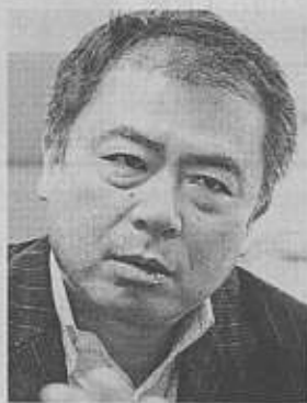
旧会館の自室で語る桜井充参院議員

各議員の引越し作業が一段落した衆参両院の新しい議員会館で明るみに出た「シックハウス症候群」。新築の建材や家具に使われる化学物質の発散が原因とみられる頭痛や吐き気の被害を国会議員らが訴えている。建設に約千七百億円もの巨費が投じられ、「豪華すぎる」との批判がつきものだったが、肝心の健康対策はお粗末そのものだった。